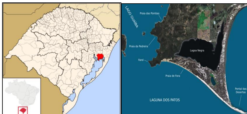
Figura 1: Localização do município de Viamão e mapa da área do Parque Estadual do Itapuã, Rio Grande do Sul, Brasil

O Parque Estadual do Itapuã (PEI) - criado no ano de 1973, é uma Unidade de Conservação da Natureza (Lei Federal nº 9.985/2000) que fica localizada no município de Viamão, a aproximadamente 57 quilômetros de Porto Alegre, no estado do Rio Grande do Sul, Brasil.