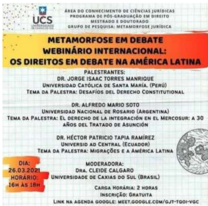
Imagem: Folder de Divulgação do Webinario Internacional - Metamorfose Jurídica.