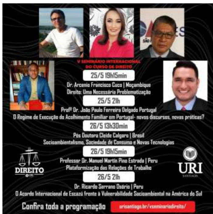
Imagem: Folder de Divulgação do Evento – URI.

O V Seminário Internacional do Curso de Direito da URI Santiago ocorrerá nos dias 25, 26 e 27 de maio de 2021 e terá como tema: "Diálogos Plurais sobre a Vulnerabilidade Humana e a Efetivação de sua proteção sob a perspectiva do Direito". Este evento será 100% virtual, com palestras com transmissão pelo canal do Youtube do curso, apresentação de trabalhos (via Meet) e será conferida certificação aos inscritos.