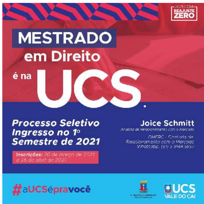
Imagem: Folder de divulgação do processo seletivo de Mestrado em Direito – Campus Universitário de São Sebastião do Caí

As inscrições podem ser realizadas até o dia 26 de abril de 2021 e possuem o valor de R$ 150,00, com desconto de 30% para alunos egressos da UCS.