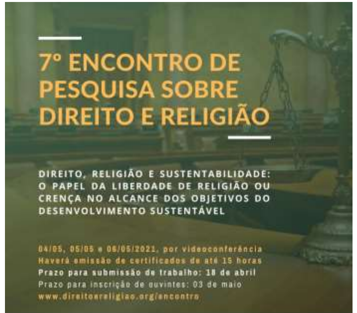
Imagem: Folder de Divulgação do Evento – Universidade Federal de Uberlândia.

Maiores informações e inscrições: https://www.direitoereligiao.org/encontro/7-encontro