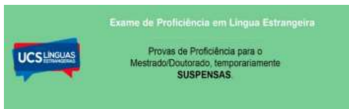
Imagem: Banner – Programa de Línguas Estrangeiras - UCS

Assim que disponíveis, o programa de línguas estrangeiras comunicará as novas datas, para o e-mail informado no momento da inscrição. Ainda não há informação sobre eventual reabertura no prazo de inscrições. Fique atento ao site https://www.ucs.br/site/ucs-linguas-estrangeiras/