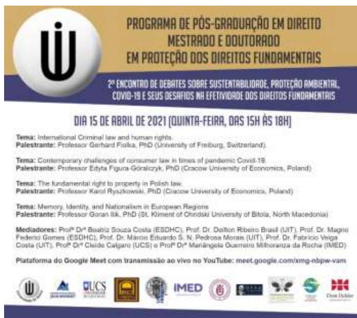
Imagem: Folder de Divulgação do Evento – Universidade de Itaúna.

Não é necessário realizar prévia inscrição, sendo necessário, apenas, registrar a presença no chat, no dia do evento. Posteriormente, deve-se enviar um e-mail para a secretaria do PPG/D da Universidade de Itaúna, para solicitação do certificado ( mestradodireito@uit.br ).