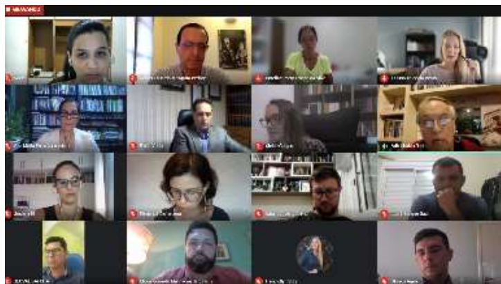
Imagem: Sala On-line, aula inaugural, PPGDir UCS.

aproveitaram a oportunidade para destacar a história, a evolução e os pontos de destaque do programa, perante a comunidade acadêmica.