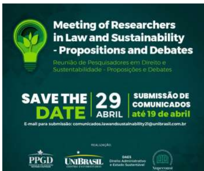
Imagem: Folder de Divulgação do Evento – UniBrasil.

https://www.unibrasil.com.br/wp-content/uploads/2021/04/Edital-Evento-PPGD-MEETING-OF-RESEARCHERS-IN-LAW-AND-SUSTAINABILITY-%E2%80%93-PROPOSITIONS-AND-DEBATES.pdf