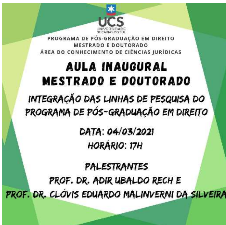
Imagem: Folder de Divulgação da Aula Inaugural, PPGDir - UCS