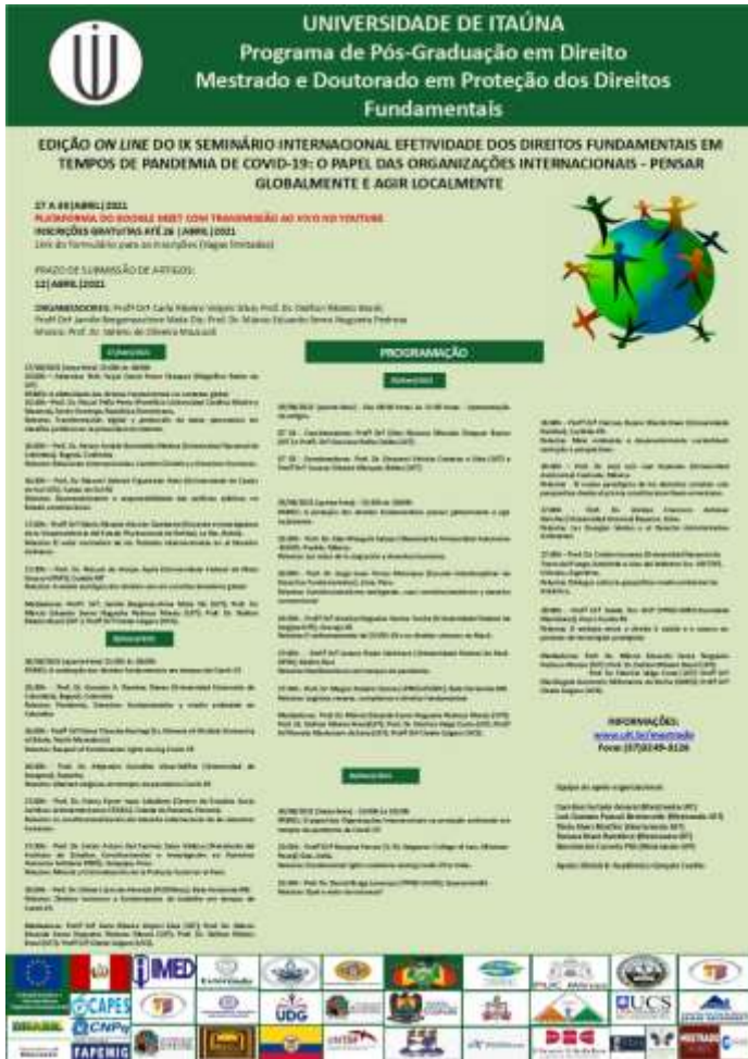
Imagem: Folder de Divulgação do Evento – Universidade de Itaúna.