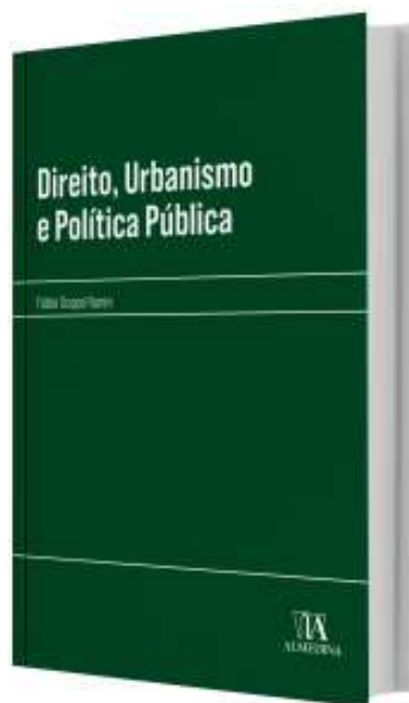
Divulgação: Editora Almedina

A obra pode ser adquirida diretamente no site da Editora Almedina , ou ainda pela Amazon estando disponível nas versões física e virtual (Kindle).