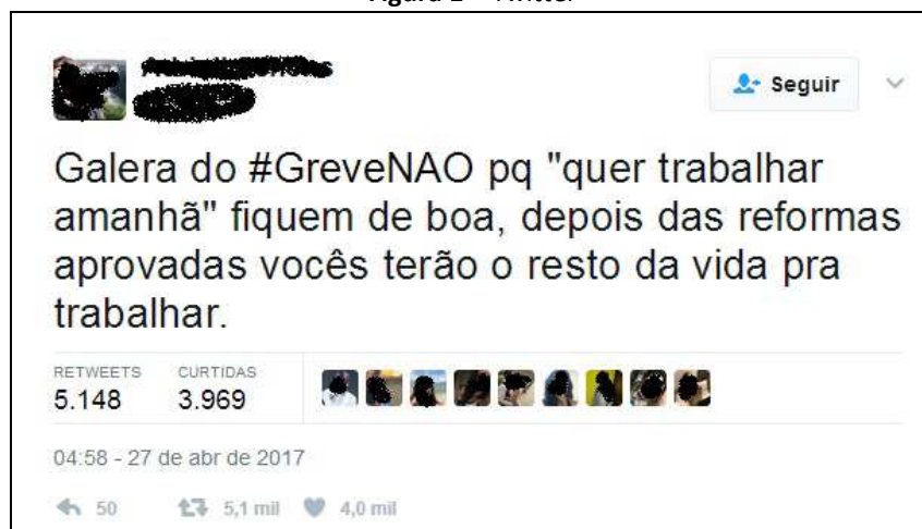
Figura 1 – Twitter

As redes sociais organizaram setores dispersos da população brasileira, sendo que o próprio conteúdo a que o usuário passa a ter acesso depende das buscas efetuadas. Seria impensável vinte anos atrás imaginar que uma figura caricata como Jair Bolsonaro pudesse angariar tantos seguidores, por meio das mídias virtuais, a ponto de se tornar um presidenciável. Assim como a “internet” possui a potência de disseminar informações em larga escala, até mesmo as que hodiernamente são chamadas de fake news na era da pós-verdade, de forma inédita conglomerou setores do ultraconservadorismo, que pareciam habitar apenas os encontros ocasionais de família, ou a mente dos taxistas dos grandes centros urbanos bombardeados pela ideologia amplamente difundida nos meios oficiais de imprensa.