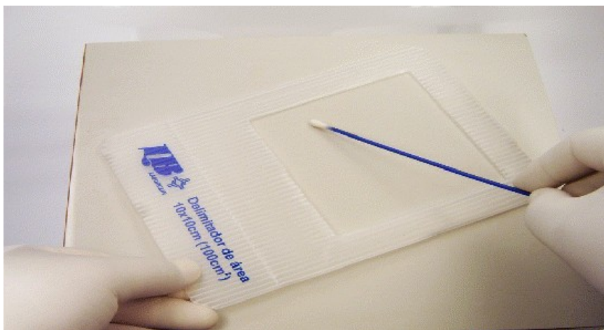
Figura 2: coleta para swab superfícies planas

2.2.3 Conforme Figura 2, o swab deve ser friccionado com pressão, formando um ângulo de 30° com a superfície teste, vinte vezes na forma “zigue-zague”, nos sentidos das diagonais, na área de coleta da superfície, no espaço delimitado pelo molde. Deve-se rodar continuamente o swab , para que toda a superfície do algodão entre em contato com a amostra.