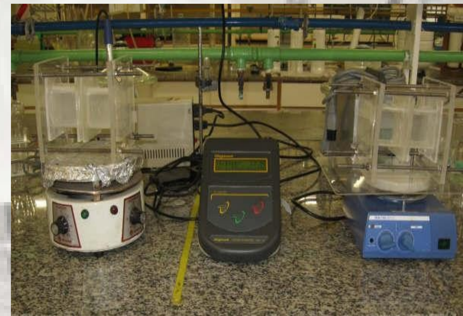
Figura 1: Esquema de Difusão.

O sistema é adaptado com uma cela de dois compartimentos de acrílico e, entre eles fica a membrana a ser testada. Cada compartimento, com agitação magnética, é montado sobre um agitador magnético. No compartimento com o lado ativo da membrana, é colocada uma solução de cloreto de potássio (KCl) 0,001 mol.L -1 , e no outro é adicionado água Milliq. Com um condutivímetro (Digimed DM-31), é medida a mudança de condutividade nos líquidos durante quatro horas (fig. 1).